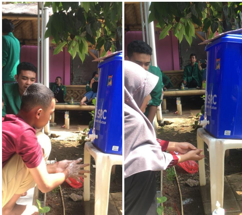
Gambar 1. Contoh Praktik PHBS dalam Kehidupan Sehari-hari

Metode ini digunakan karena jika ditanamkan sejak dini dirasa efektif dan juga memberikan nilai yang positif bagi anak-anak agar dapat menjalankan kehidupan dengan membiasakan menerapkan pola hidup bersih dan sehat.