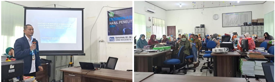
Gambar 1. Tahap Sosialisasi Diseminasi dan PKM

Keguruan dan Ilmu Pendidikan, Universitas Mulawarman. Materi sosialisasi memuat kebijakan sistem penjaminan mutu pendidikan, kepemimpinan dan kebijakan kepala sekolah, efektivitas kepemimpinan kepala sekolah dan evaluasi manajemen peningkatan mutu.